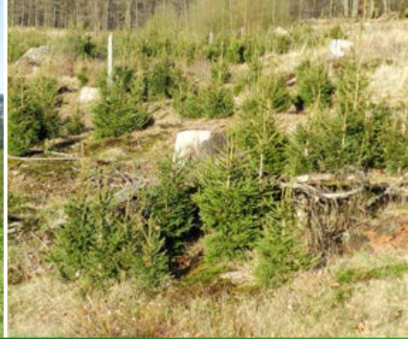
3 – Kyrillflächen neun Jahre nach dem Orkan.