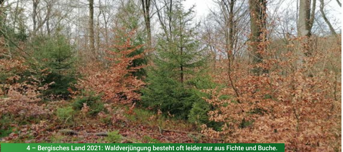
4 – Bergisches Land 2021: Waldverjüngung besteht oft leider nur aus Fichte und Buche.