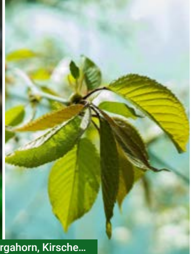
Bevorzugt vom Rehwild: Bergahorn, Kirsche...