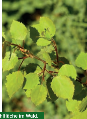
Ebereschen, Weiden und Aspen besiedeln jede Kahlfläche im Wald.

Dabei wäre milder Humus notwendig, um Wasser zu speichern. Das Fehlen von Ebereschen, Salweiden und Aspen auf den Flächen hat noch weitere negative Auswirkungen auf die Wiederbewaldung. Wichtige Funktion dieser Vorwaldarten sind neben der Bodenverbesserung der Schutz des Bodens und der nachwachsenden Bäumchen vor Spätfrösten und Hitze. Die „Hauptbaumarten“ – im Sinne eines künftigen, klimastabilen Waldes – können sich oft erst im Schutz dieser Vorwaldbäumchen etablieren.