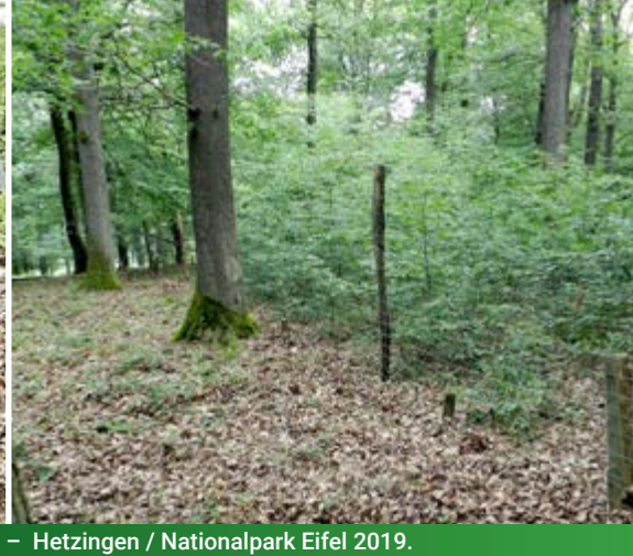
5 – Königsforst im Mai 2017. | 6 – Hetzingen / Nationalpark Eifel 2019.