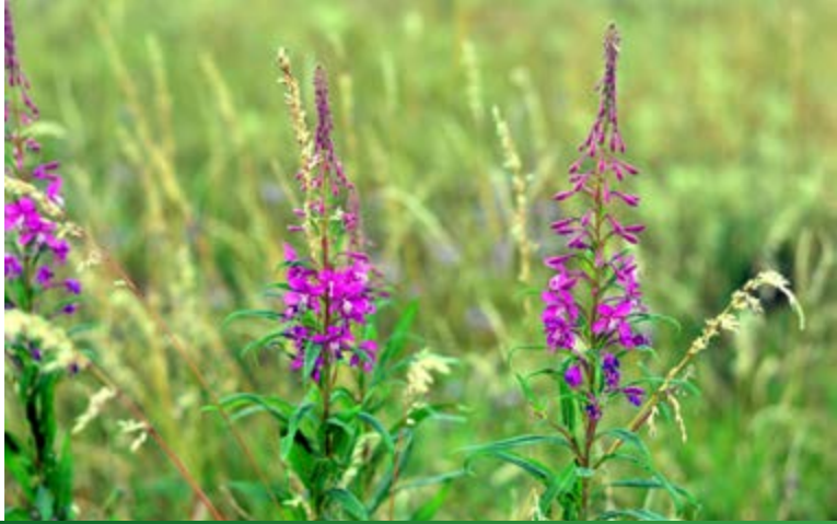
...und Eiche. Auch das Schmalblättrige Weidenröschen ässt das Reh gern.

Neben den materiellen Schäden verursacht massiver Verbiss auch ökologische Folgeschäden. Durch die Überweidung wachsen am Waldboden oft nur ökologisch wenig wertvolle Allerwelts-Gräser. Seltene und in ihrem Bestand gefährdete krautige Arten werden dagegen selektiert, das heißt, es findet eine Verschiebung des Artenspektrums statt. Wichtige Waldarten wie das Schmalblättrige Weidenröschen werden fast komplett von den Rehen gefressen. Eigentlich würde sich diese Art auf Kahlf Flächen rasch massenhaft ausbreiten. Aufgrund des Fraßdruckes kommen außerhalb von rehdichten Gattern keine Weidenröschen zur Blüte. Damit fällt diese Art als Wirtspflanze für Waldinsekten aus.